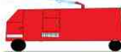
Luděk 3. ročník