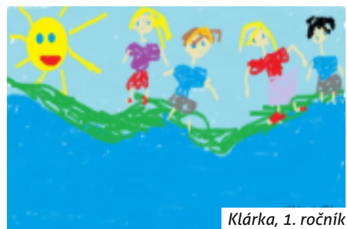
Klárka, 1. ročník