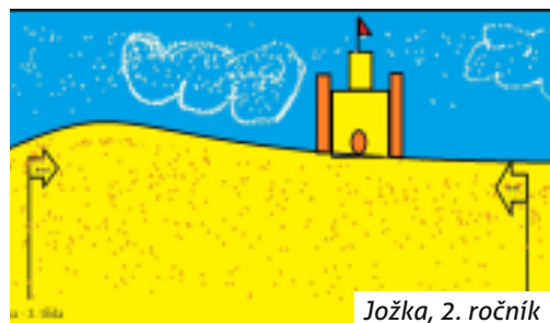
Jožka, 2. ročník