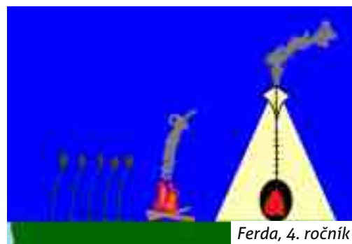
Ferda, 4. ročník