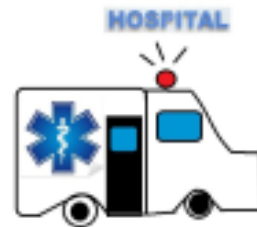
Barča, 3. ročník