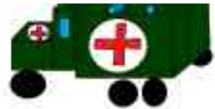
Maťo, 3. ročník