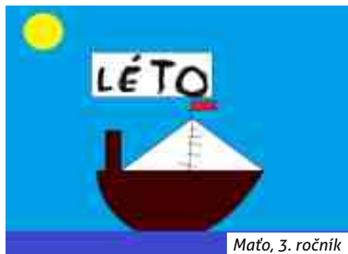
Maťo, 3. ročník